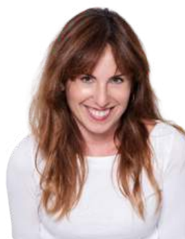
Beatriz Torres Copywriting